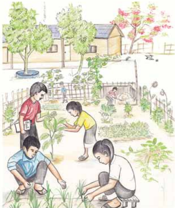
ຈັດພິມໂດຍ ສວນພຶກສາຊາດຕາຕັດແກ້, ຫຼວງພຣະບາງ 2013

ໂດຍ: ມາຣີ ອິກເລ ສເຕຣສເຊີ, ຟລໍຣຽນ ໄອເບີເມຍຣ໌ ແລະ ປຣະສິດ ແສງອໍາພອນ ແຕ້ມໂດຍ: ກິງເງິນ ແສງດີ